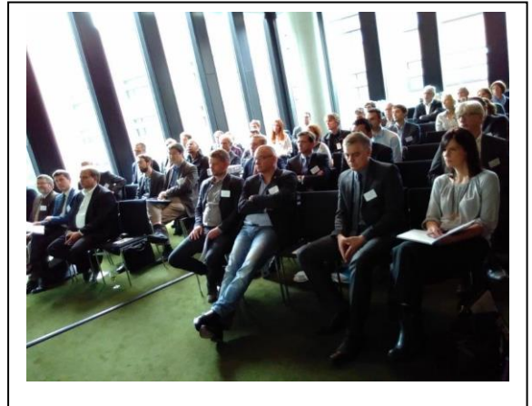
Teilnehmer des ersten MARSAT Workshops Sept. 2017. Teilnehmer von Behörden und Wirtschaft nutzten die Gelegenheit zu intensiven Diskussionen rund um das Thema „Earth Observation for the Maritime Industry“

Das Anwendungspotenzial von neuartigen Fernerkundungsdiensten in der maritimen Wirtschaft wird als sehr hoch eingeschätzt. Der wachsende Bedarf an räumlichen Informationen, Daten und Dienstleistungen in diesem Bereich ist in verschiedenen Nutzergruppen deutlich erkennbar.